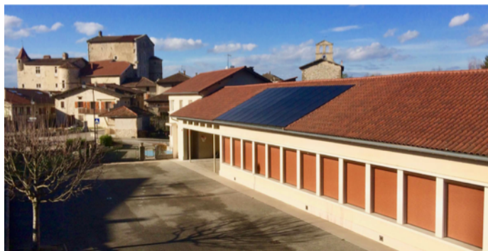
Une des 17 toitures photovoltaïques installée par les Centrales Villageoises Portes du Vercors

Cette réunion sera suivie à 18h00 par l'Assemblée Générale des Centrales Villageoises Portes du Vercors ouverte à tous ceux qui souhaitent assister à ce moment fort de la vie de ses associés. Elle se clôturera par un tirage au sort de quelques surprises et par le verre de l'amitié.