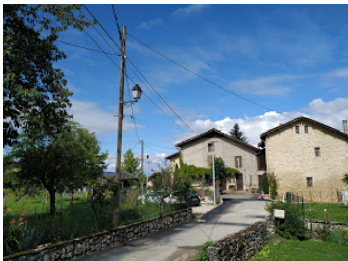
Bientôt la fin des lignes aériennes dans le Bourg...

Travaux d'enfouissement des lignes électriques : interrompus pendant le confinement, ils ont repris en Mai dernier et seront terminés à l'automne prochain.