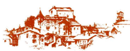
MAIRIE DE 38680 SAINT-ANDRE-EN-ROYANS